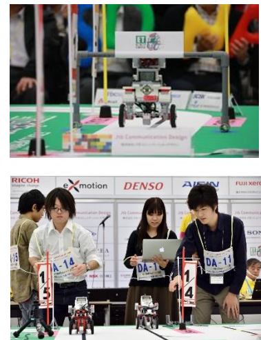
昨年のチャンピオンシップの様子