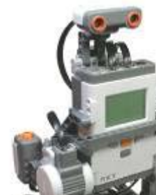
ETロボコン 規定走行体